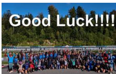
Participación chilena en el IBU Camp junior estival desarrollado en Arber.