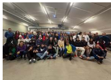
Síntesis visual del trabajo federativo desarrollado durante 2025.