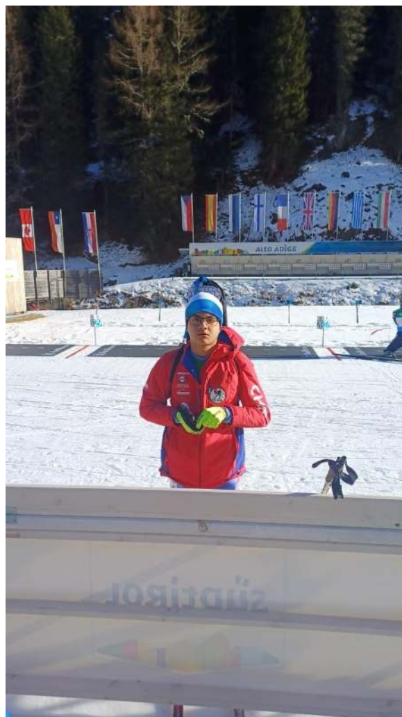
Concentración previa y participación en el circuito internacional del último trimestre del año.