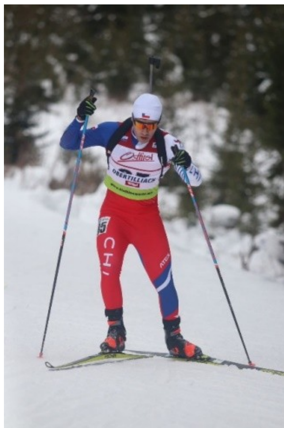
Delegación y escenas del Campeonato Mundial Junior 2025.