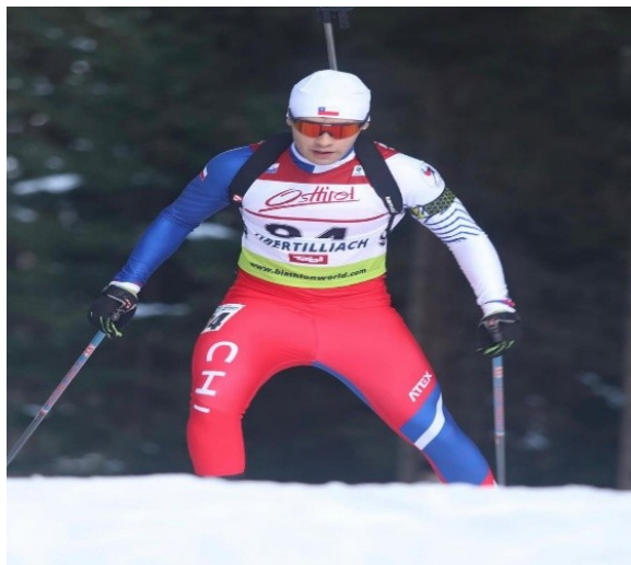
Registro de participación y preparación del seleccionado adulto en competencias y desplazamientos internacionales.