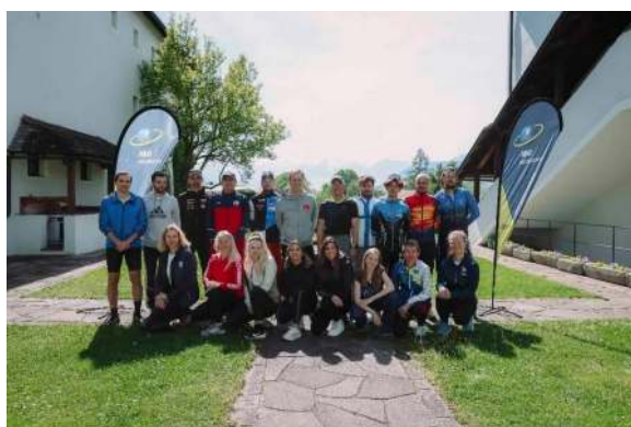
Actividades formativas de cierre de año y equipamiento adquirido para fortalecer el desarrollo de base.