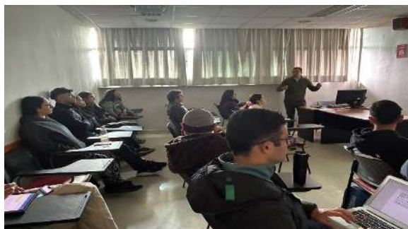
Capacitación internacional de entrenadores y curso de jueces desarrollado en vinculación con la Universidad Andrés Bello.