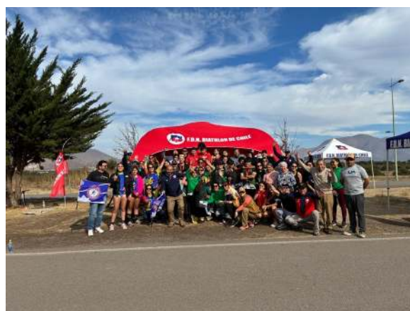
Firma de convenio, actividades asociadas y fortalecimiento de la red institucional de apoyo.