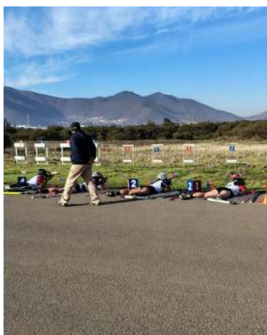
Actividades nacionales de Roller Biathlon y fechas invernales durante la temporada 2025.